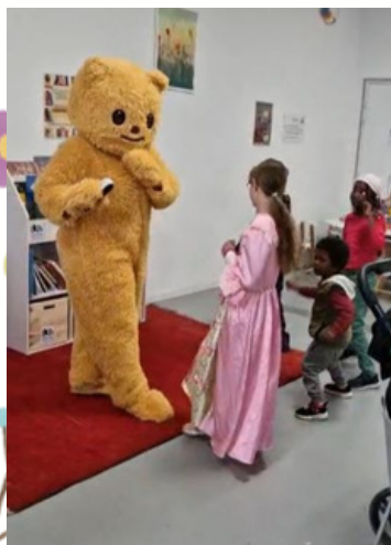
Un mercredi après-midi avec les enfants